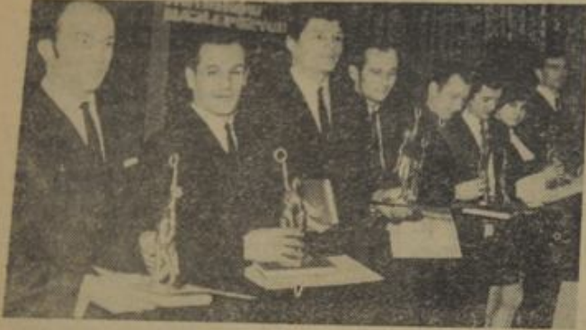
Oto zwycięzcy plebiscytu, najlepsi hutnicy-sportowcy. Pierwszy z lewej: medalista olimpijski z Meksyku Stanisław Dragan.

Resztę wieczoru wypełniła przyjemna zabawa taneczna. Bawili się wszyscy — świetnie, wesoło, po sportowemu a do tańca przygrywał młodzieżowy zespół klubu ZDK HIL w Grębałowie „Śródpole”. (jd)