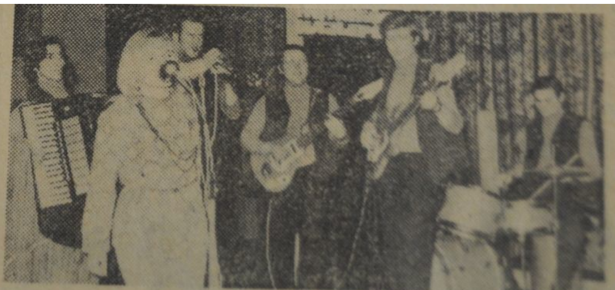
Do tańca przygrywał zespół instrumentalny Klubu ZDK HIL w Grębałowie.

21. Głos s Nowej Huty, 1970, nr 9, str. 8