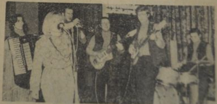
Do tańca przygrywał zespół instrumentalny Klubu ZDK HIL w Grębałowie.